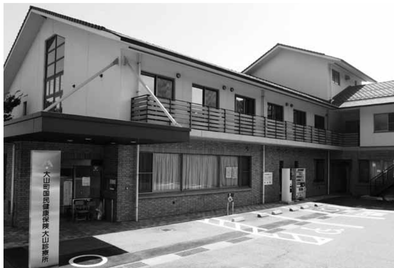
早期の医師確保が待たれる大山診療所

【岩井】財政状況が厳しい中、大山診療所の対応が急がれると考えるがどうか。 【町長】県施策の動向も視野に入れながら、大山町の地域医療の重要性を強く訴え、医師確保に尽力する。