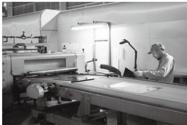
誘致企業のひとつ(片木アルミニウム製作所)

【竹口】企業誘致で町内雇用はどの程度増えているのか。 【町長】3年間で町民の新規雇用は、50人を超えている。 【竹口】町民の就職希望者数は職種ごとに把握しているのか。 【観光商工課長】把握できていない。 【竹口】誘致企業の従業員