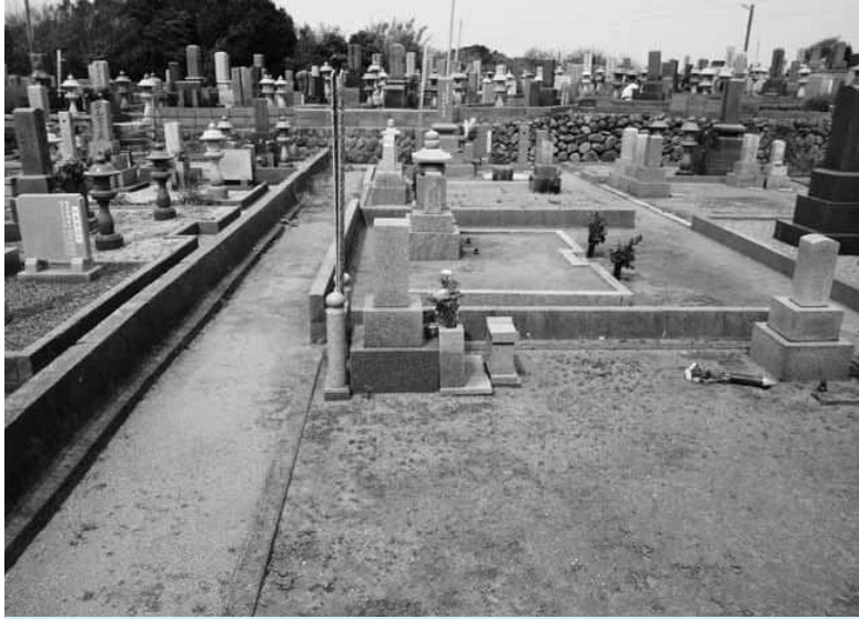
整備が待たれる墓地