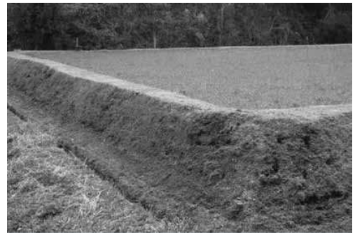
イノシシが崩した土手

【米本】近年、イノシシやシカの農作物への被害が拡大している。中山地区ではシカがブロッコリー畑に入り、食い荒している。イノシシも最近では民家近くまで降りている。早急に対策を講じる必要があるのでは。