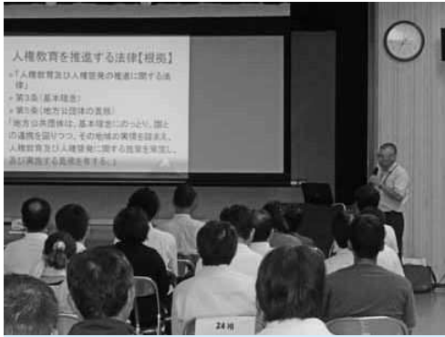
人権を拡大する法律の学習

がい者、女性、在日コリアンの人々を人間以下の存在としてさげすみ、人格権と生存権を否定されつづけて生きることを強いるものである。