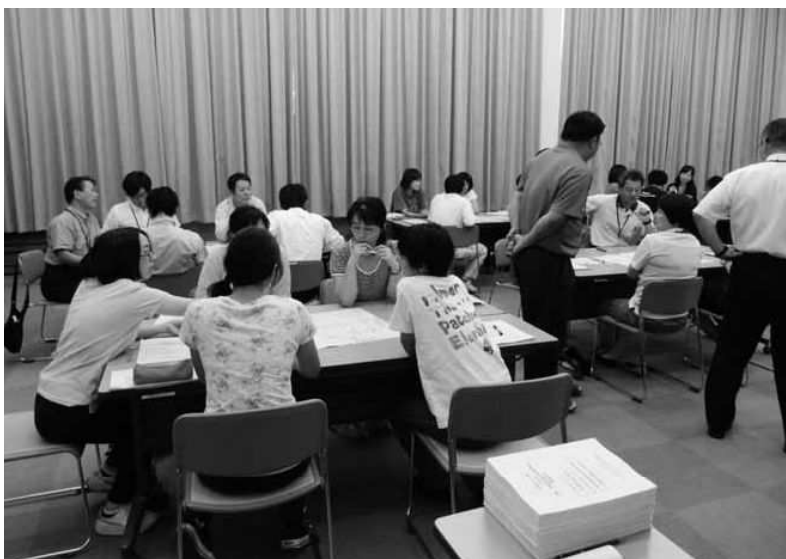
支えあいともに生きる研修