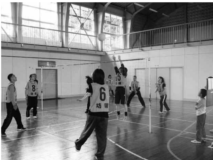
交流を深める男女

うな場をつくる働きかけもしている。婚活は、町を挙げて、知恵やアイデアを出して取り組む価値のある事業である。