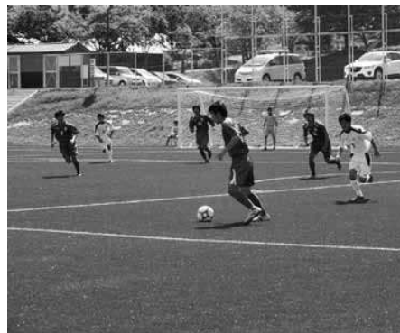
元気いっぱいな若者