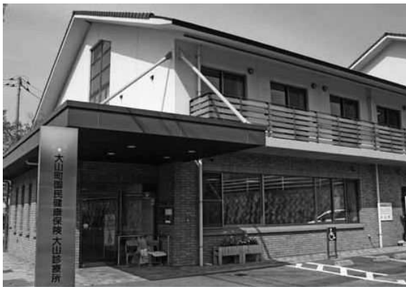
固定医を待つ大山診療所

機関として可能な限り存続させていく。そのために、固定医の確保、受診者の確保、経費節減など経営安定化へ取り組む。