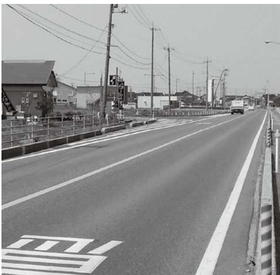
商業施設の減少が続く国道9号線

【近藤】大山町の現状をふまえ、20年先の町の産業がどうなっているかと想定するか。 【町長】10年もたてば世の中はすっかり変わるので、20年先がどうなっているか、タイムマシンがあれば別だが、予測したい。 願いを込めて予測すれば、自然や歴史、文化など大山の恵みを活用し、循環型の農林水産業や体験交流型の観光業、自然エネルギー