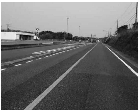
交通量の減った国道9号線

【西尾】山陰道は、昨年開通して3カ月がたった。メリットも多いが、9号線沿いの衰退も、想像以上に深刻なものだと考える。 沿線の町はどれも同じような悩みを持っているが、有効な活性化策を出していない。どのようなことに力を入れていくのか