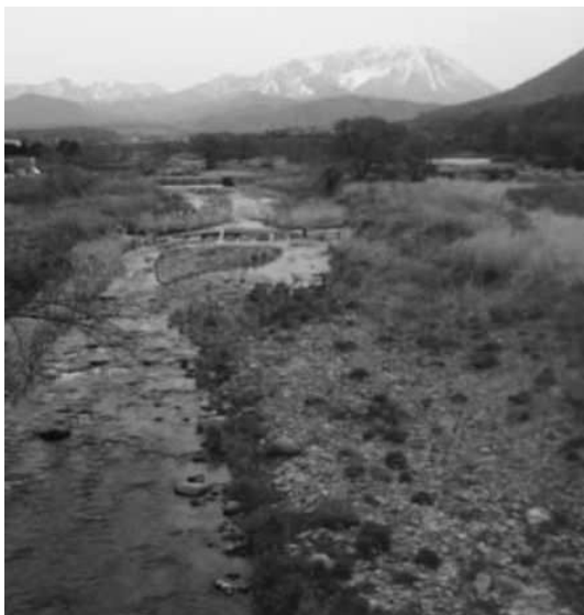
いつまでもきれいな川で