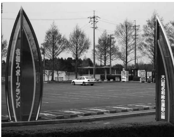
名和総合運動公園

【西尾】行財政改革の一環として、業務の一部を法人などに任せて財政負担を軽くする指定管理者制度をとっている。今後の財政状況によっては、指定管理の施設が増えることも予想される。 選定にあたって重要なことと、現在の指定管理事業者の数は。 【町長】施設の目的を適正なサービスのもと、効果的かつ効率的に達成する見込みがある事業者を選定している。 9区分の施設に、7事業者ある。 【西尾】計画の実施状況やサービス実態の評価を行っているか。