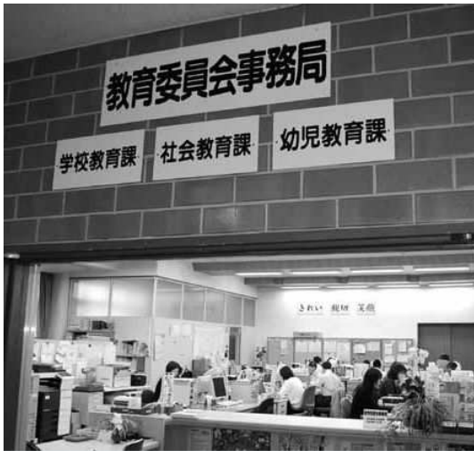
教育委員会の今後は

【吉原】改革案は、新教育長の任期を3年とし、首長に任命権を与えるなど、教育行政への首長の関与を拡大する。 これからの教育委員会の役割と活動の考え方は。 【教育委員長】本町では、町長と教育委員会が一定の中立性は保ちながら、意思疎通をはかっている。今後の改革の動向を見守っていく。 【吉原】保・小・中連携など、他町に先がけて