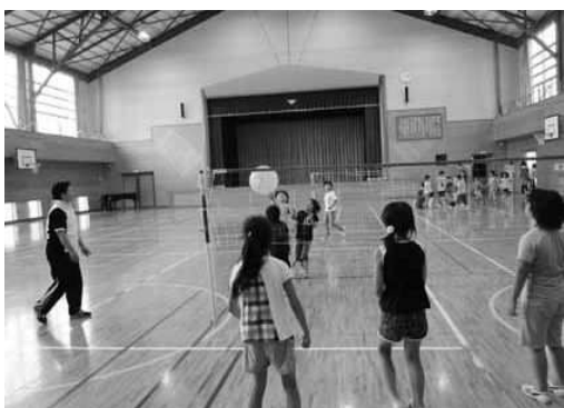
放課後遊びの様子

【教育委員長】4年生までの児童を対象にしているが、国の方針が示されれば検討したい。