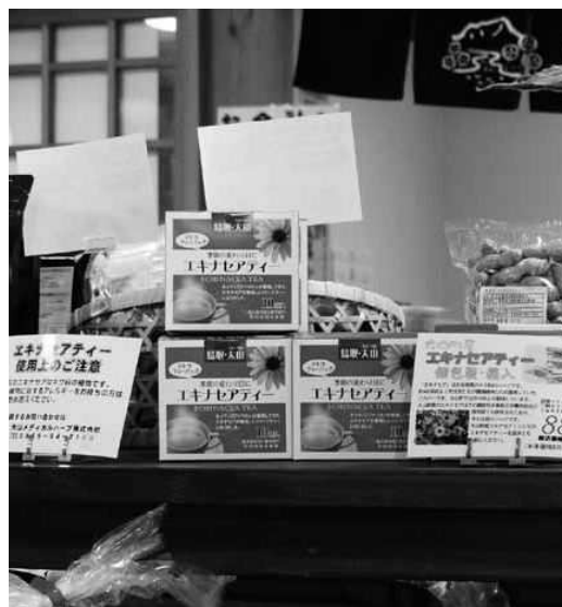
町内産エキナセアティー（道の駅）

【丸岡】 文科省は、古くなった小中学校の校舎を建て替えるのではなく、部分的な改修によって耐久性を高めるよう地方自治体に促すことを決めた。 これは建物が設計図通りに建てられていることが前提である。 これまで見た公共建築物でも土間コンクリートを打たずに、土の上に直接タイルが貼ってあったり、床に鉄筋が1本も入っていないものもあった。過去に小中学校での工事管理上の問題はなかったか。 【教育委員長】 学校の校舎のような大規模な工事の監理業務は、一級建築士を有する設計事務所に委託している。また、県による建築確認と完成検査を受け、合格している。問題は無い。