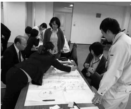
ワークショップでの意見交換