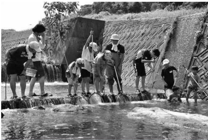
自然のなかでの体験活動