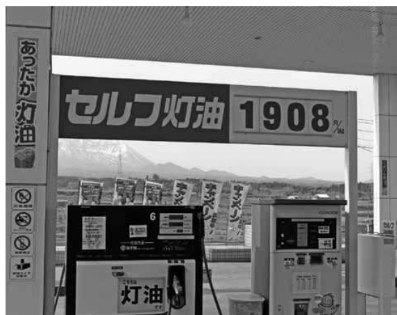
値上がりした灯油

【丸岡】 総務大臣は、寒冷地の自治体が低所得者向けに灯油購入費を補助する事業について、「3月の特別交付税で必要な措置を講じる方向で検討したい」と発言している。 本町でも検討する必要があるのではないか。 【町長】 今後の交付税措置の状況や内容をよく確認し、灯油価格の推移なども勘案して、検討する。