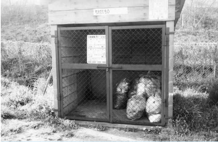
集められた可燃ごみ