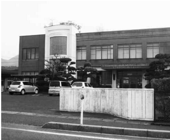
地域自主組織に隣接する高麗分館

【教育委員長】 公民館活動は分館がある大山地区に比べ、中山・名和は小さな単位での取り組みが少ない。旧保育所を利用したそれぞれの地域の活動が、分館的存在になればと期待している。