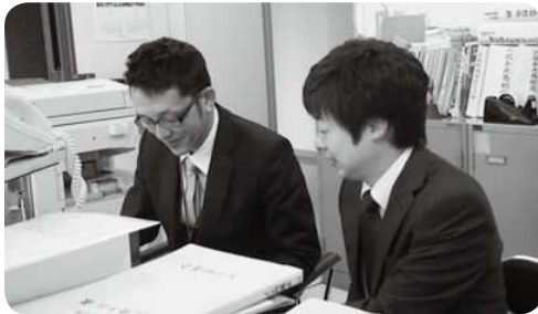
業務の引き継ぎ中