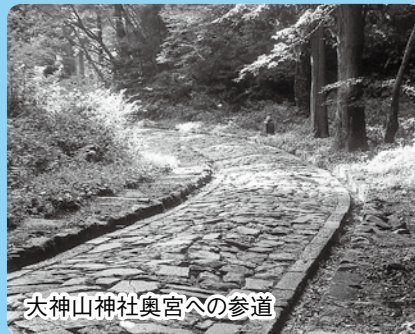
大神山神社奥宮への参道