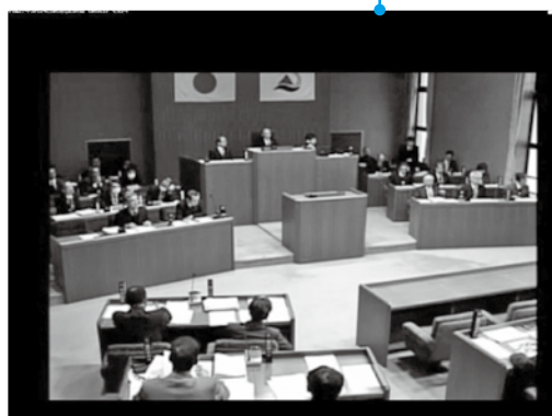
議会インターネット中継 本格運用