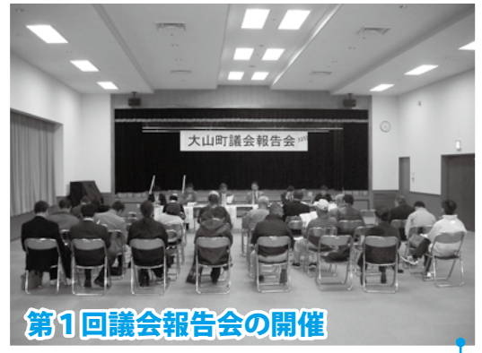
第1回議会報告会の開催