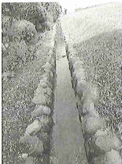
写真左側の石積護岸、乱積（安山岩） （場正免井手沿い）

種別：石積護岸 保存計画番号：【TG-G-23-1】 員数：1面（41m） 所在地：鳥取県西伯郡大山町所子字場正免 424 番地