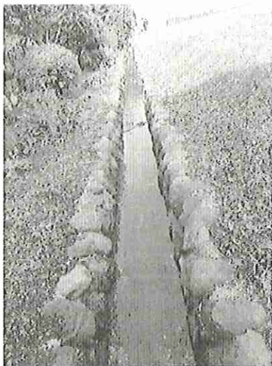
写真右側の石積護岸、乱積、安山岩 （場正免井手沿い）

種別：石積護岸 保存計画番号：【TG-G-19-1】 員数：1面（55m） 所在地：鳥取県西伯郡大山町所子字場正免 417-1 番地