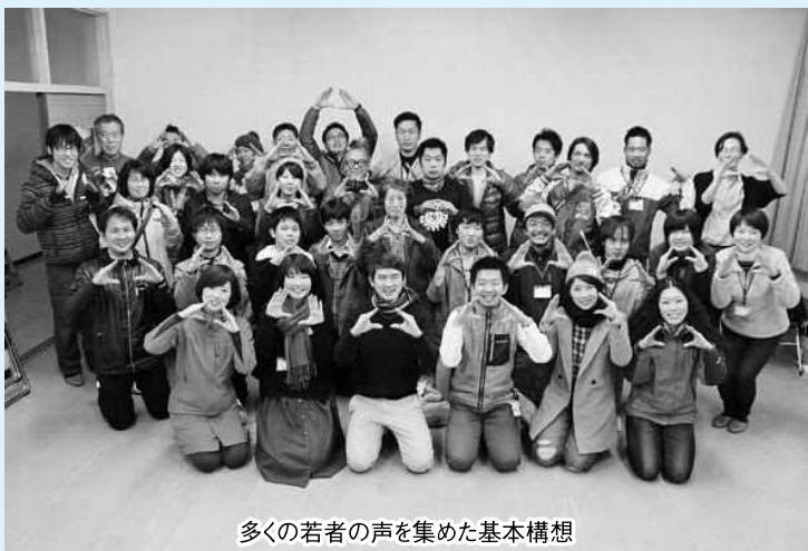
多くの若者の声を集めた基本構想

【賛成：加藤議員】基本理念の「楽しさ自給率の高いまち」をもとに、未来会議で70人以上が社会実験も含めまとめられた。私たちはこの人たちに託していいのではないか。