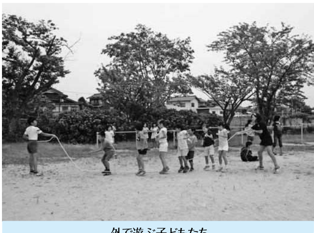
外で遊ぶ子どもたち

【吉原】テレビゲーム、パソコン、携帯電話など電子メディアの急速な普及で、子どもたちの生活は大きく変わり、危険にさらされている。 学校や保護者だけの問題ではなく、行政としても正確な認識を持ち、早急な対応が必要ではないか。 【教育委員長】たいへん危惧しており、各学校やPTAでノーメディア週間などの取り組みを行っている。 【吉原】子どもの脳や視力への影響は深刻である。町全体の実態調査を行い、保・小・中の連携を生かして、対策を行うてはどうか。