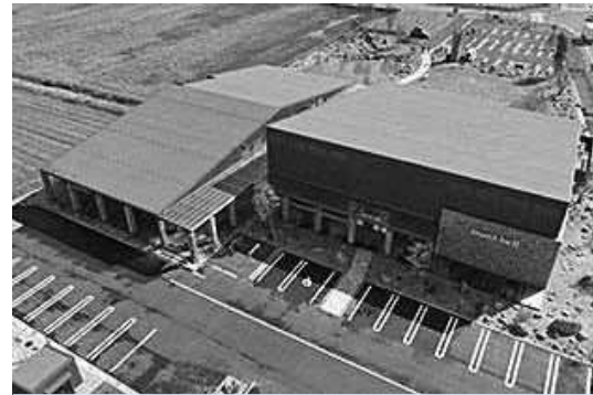
富山県立山の「山の駅」

域として取り組むのであれば、町としては可能な限り支援を考える。 〔大杖〕開山1300年は目の前で待ったなしである。プロジェクト推進にどうしても必要な経費が発生した場合、次年度予算を前倒しする考えはないか。