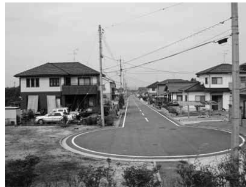
ICに近いナスパルタウン

【西尾】本町の人口は5年前と比べて1000人あまり減少した。人口流出の約半分が米子市への転出である。 山陰道もでき、住みやすい環境を生かし、宅地整備を進めるようだが、基本的な考え方は。 【町長】町外通勤者や若者世代にはIC周辺であることや、教育環境がポイントになると考える。中山地区はナスパルタウンがあるのでIC付近は外した。