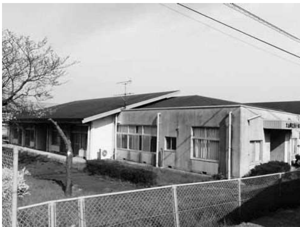
有効活用が必要な旧所子保育所

【杉谷】町が現在保有している土地建物には、遊休物件が見受けられる。維持管理費軽減のため、長期的な視野に立った町有財産の適正管理に努める必要がある。 個々の物件ごとに有効利用を検討し、活用が見込めない場合は、隣接の集落への無償貸与や隣接者に払い下げを優先し、希望がなければ町民や企業などに売却してはどうか。 【町長】遊休町有地の処分活用検討会議を設置し、太陽光発電などの有効活用を進めている。 【杉谷】保育所の統廃 合などで未活用な建物があるが、青少年の犯罪の温床になりかねない。これらの施設は地域の中心的な位置にあり、まちづくりを行う上で早急にさまざまな活用方法の対応が必要と思うが。 【町長】地元と地域自主組織で有効活用がない場合は、民間での活用を進める。