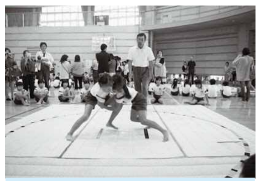
名和小学校の相撲大会

〔西山〕名和小では毎年相撲大会を開いている。土俵場の設置を望む人が多いがどうか。 〔教育委員長〕旧庄内小学校で取り組まれた行事を受け継いでいるが、行事は大切にしたい。グラウンド内に設置すれば一定の面積が占有される。施設や環境整備を優先したい。