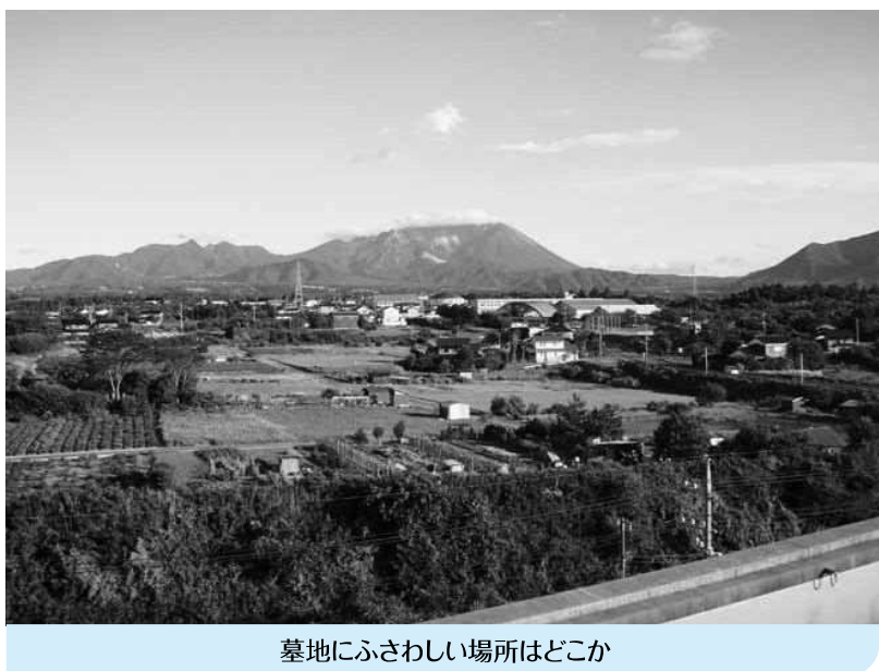
墓地にふさわしい場所はどこか

【町長】移住・定住を進めている町として、墓地の確保は必要な課題と考えている。そのような思いから、昨年、適地を選定し、関係者に説明を行った。土地の所有者には了解をもらったが、隣接の人に理解をいただけなかったため、断念した経過がある。今後は、新たな場所を選定して、取り組み