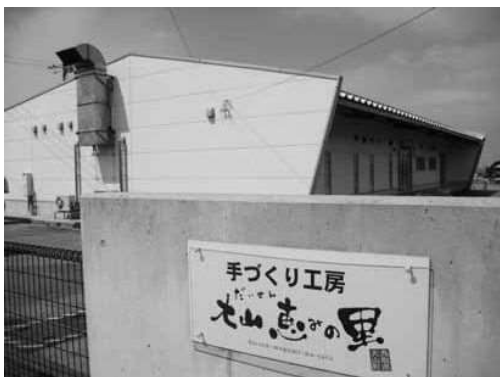
いつになったら収支の改善がはかれるのか

【米本】平成22年から稼働し、恵みの里公社に貸し出した農産物処理加工施設は、稼働から2年間は緊急雇用対策によって年間2000万円もの交付金の手当てされ、利益も確保されるはずだった。 しかし、実際はやっとの事で決算をしていた。その後は合併振興基金などで、予算措置を続けてきたのは事実である。 6年経過したいま、毎年補助金を支出する