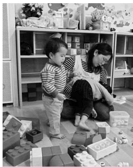
保育所が救いの手

〔岩井〕出産ママは生まれたばかりの赤ちゃんとゆつくり過ごせる時を、育児休暇をとりながら、1年間の休養を希望している。 おなかで10カ月間育て、そして命がけの出産を終え、疲れた身体を立て直すには、1年間の休養が必要不可欠である。