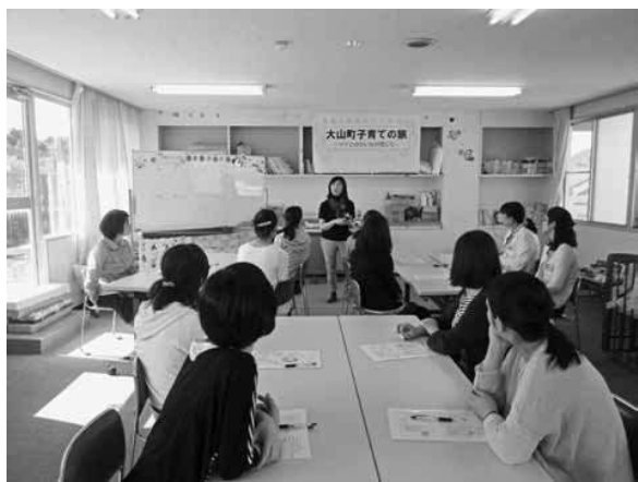
育児の不安解消を

【遠藤】子育て支援策が、必要とする人に十分に理解されていない。現在取り組んでいる主な施策は何か。 【教育委員長】子育て支援センターを3カ所設置し、家庭で子育て中の保護者同士の交流、育児の不安や孤立感の解消をはかっている。学習プログラム「子育ての旅」は、回数を増やし、保護者の養育能力の向上、保護者同士の交流をはかっている。