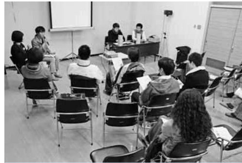
楽しさ自給率を高めるために

〔近藤〕総合計画「未来づくり10年プラン」の基本理念「楽しさ自給率の高いまちへ」とはどういうことか。 これを実現するためには、必要なことは何か。 〔町長〕魅力あるまちを作るためには、一人ひとりが一歩を踏み出し、行動していかなければならぬ。その一歩を後押しし、行動を支えるのは、楽しさである。 町内には、自然や文化など、楽しさのよき資源がたくさんあり、それらを生かし