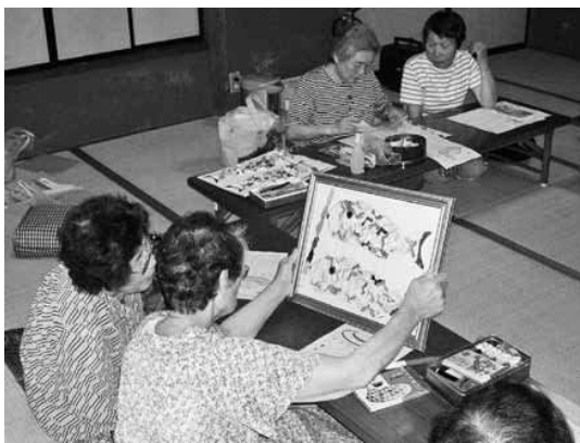
地域の力で介護予防

【吉原】地域包括ケアシステムは、高齢者に住まい、生活支援、医療介護予防を一体的に提供したいへん重要な仕組みである。 住み慣れた地域で、自分らしく暮らせる生活モデルを実現させることが求められているが、今の状況は。 【町長】医療機関と連携した取り組みを進め、医療から在宅生活へのスムーズな移行、見守りや安否確認の活動を行う地域づくりの取り組み