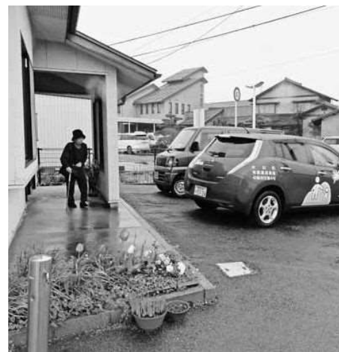
安心してこの町で暮らすために

【丸岡】デマンドバスを予約したが、決められた場所の近くで寒さをしのいでいたら、バスは依頼者を探さずに走り去ってしまったそうだ。 こういう事例は町長のいう「人にやさしく安全・安心して暮らせるまち」と相いれないのではないか。 【町長】スマイル大山号は「タクシー」ではなく「デマンドバス」である。 利用区間や乗降場所、運行時間が決まっています。運行には一定の制約があることを理解してもらいたい。