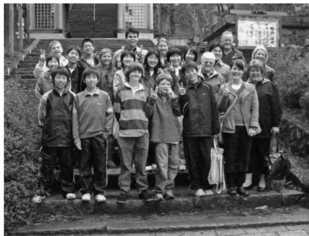
中学生主体の国際交流事業

〔町長〕全海外研修は、アメリカ合衆国のカリフォルニア州テメキュラ市、また韓国江原道襄陽郡との交流研修も含めた国際交流事業へ支援を行っている。 また国内研修旅行については、個別の事業で必要な場合は予算化している。 新たな研修旅行という事業は考えていない。