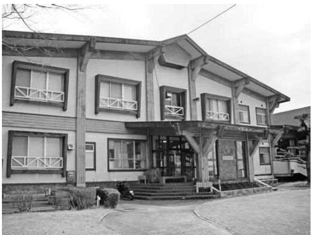
どうすれば改善できるのか

今後も指定管理者の営業努力に期待する。 【米本】町民が利用できないのなら経費削減のため、サッカー協会と指定管理者の間を取り持つ職員はいらないのでは。 【町長】次年度からは、非常勤とするように協議をしている。