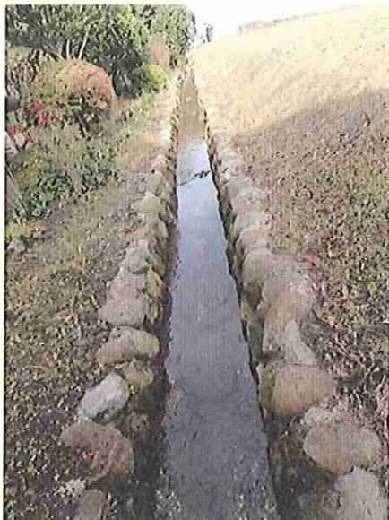
写真左側の石積護岸、乱積（安山岩） （場正免井手沿い）

所在地：鳥取県西伯郡大山町所子字場正免 171-1 番地と 424 番地に挟まれた水路