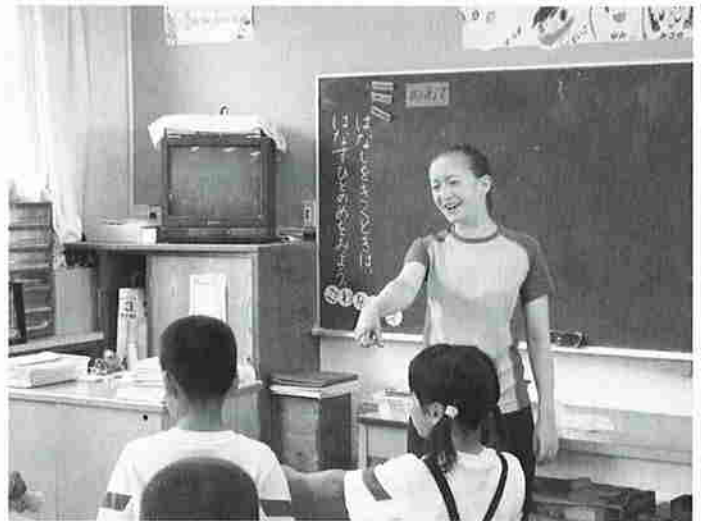
小学校から英語に親しみます