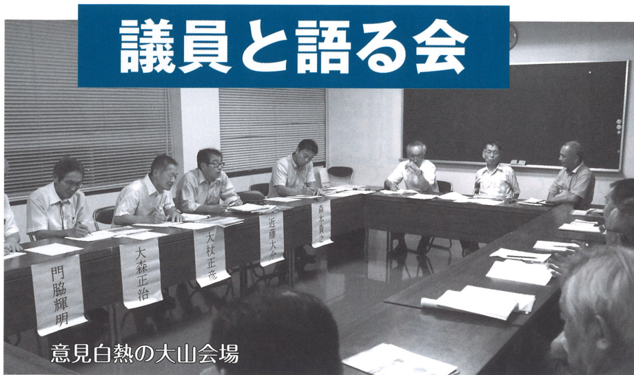
意見白熱の大山会場