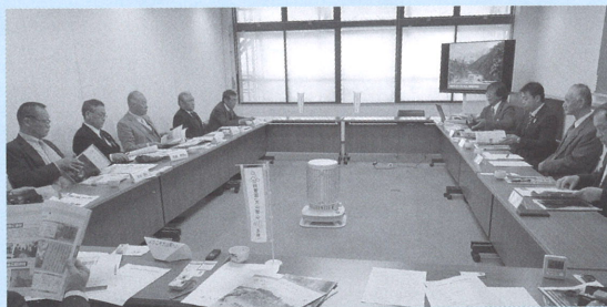
紙面づくりで意見交換