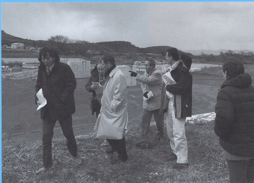
町道坊領向原線橋梁上部工事現場

12月8日・11日の2日間、所管する各課から説明を受けた。 11日午後から、町道坊領向原線橋梁上部工事現場、蔵岡渡しの潜水橋、参道ステーション、コモレビト、南光河原トイレの現地視察を行った。12日に大山恵の里公社との懇談会を行い、現状と課題について意見交換を行った。また、議会閉会中の12月25日に平成29年度事務事業評価の説明を、農林水産課、観光商工課から受けた。