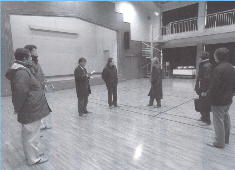
中山地区羽田井の活性化センター

12月8日、税務課の滞納対策の取り組みや地籍調査課の進捗よく状況など所管する各課の事務調査を行った。11日には劣化が進む名和総合運動公園の陸上トラックを視察した。また、利用者の少ない活性化センターの活用については、子供から大人まで楽しめるラジコンサーキットにしてはとの意見もあった。