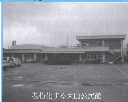
老朽化する大山公民館

Aまだ、検討はしていない。地域自主組織からは、運営を任せてほしいという声もある。関係する地域や自主組織、企画情報課を交えた話をこれから始める。