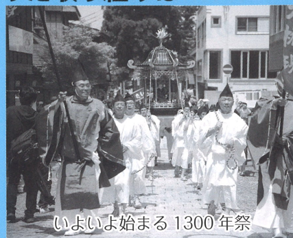
いよいよ始まる 1300年祭

A 5月20日の開創法要をはじめ、5月から11月にかけて、「開く・遊ぶ・灯す・調ふ」の4つの構成で様々なイベントを開催する。また、JR西日本のキャンペーンと連携し、大山の知名度向上をはかっていく。