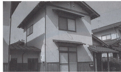
修繕し新たな入居を待つ町営住宅

今在家団地、ひかりが丘団地、さざんか団地、若者向け住宅などを見込んでいます。主に退去者の対応で、今後発生が見込まれる。