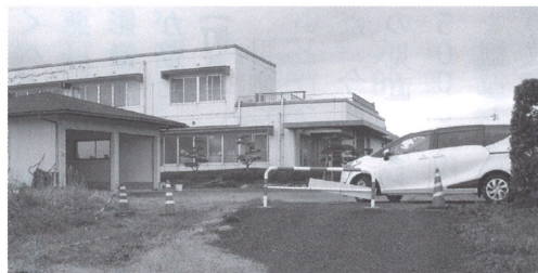
進入防止柵を追加します