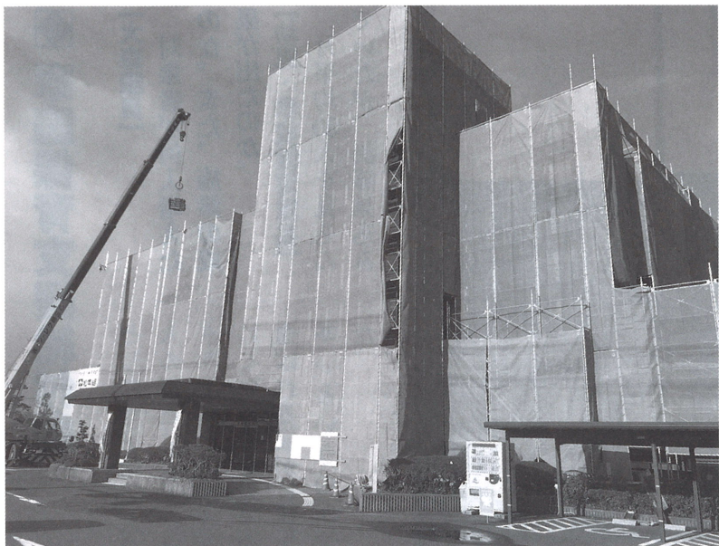
外壁改修中の本庁舎