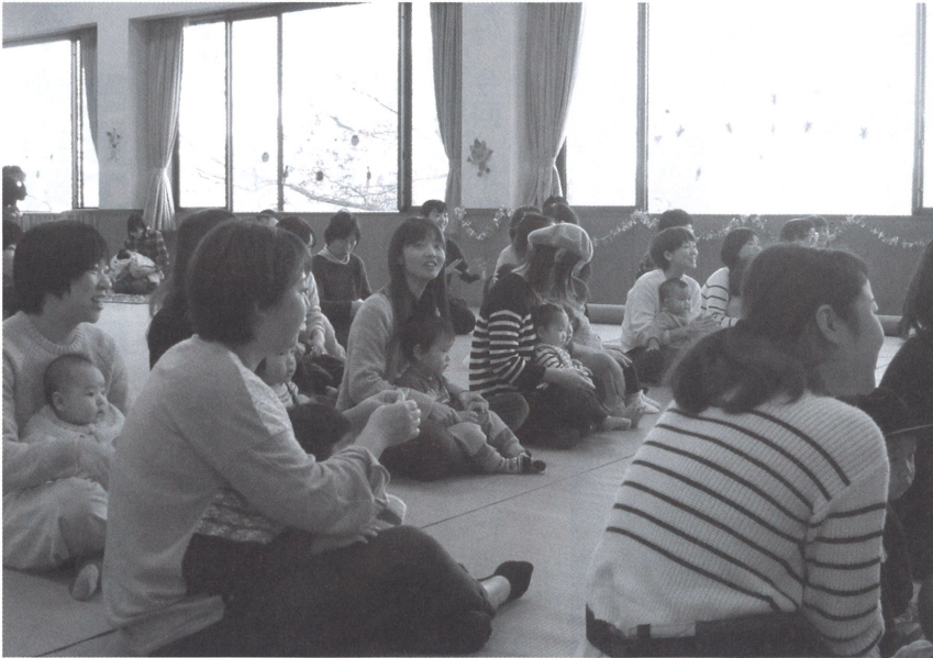
家族と豊かなふれあいを