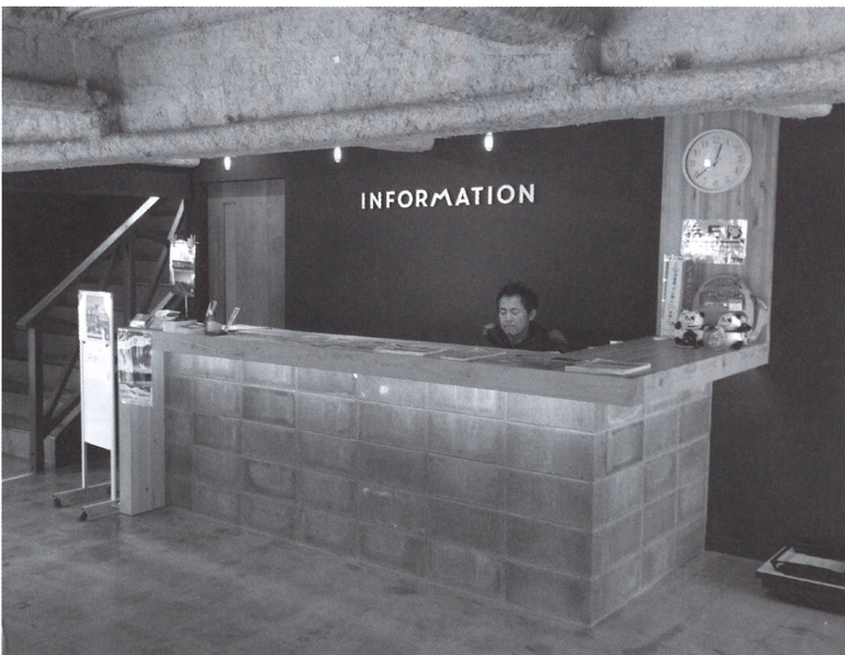
観光案内所を使いやすく改修 (大山寺 コモレビト)