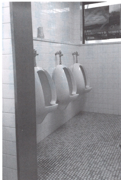
改修が待たれるトイレ