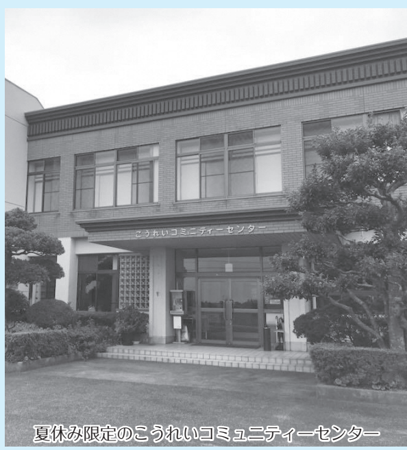
夏休み限定のこうれいコミュニティーセンター

し込みが定員を超える見込みとなったため、大山西小校区で1箇所増設することとなった。