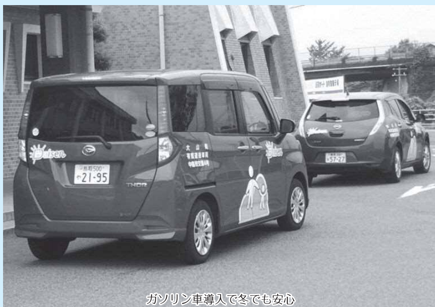
ガソリン車導入で冬でも安心

ガソリン車2台を平成29年度末に購入し、ガソリン代がひと月約4万円かかり、その費用である。