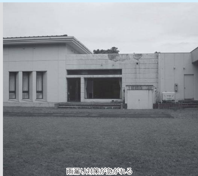
雨漏り対策が急がれる