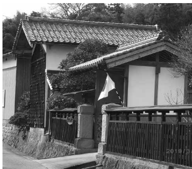
休日は増えるけど

【米本】山陰を通る新幹線は、昭和48年に基本計画12路線が決定したが、いまだに進んでいない。 この計画では中国横断の路線と福岡までの山陰新幹線があって、今はどちらも議論されている。福岡までの路線が本町の魅力を生かせると思う。山陰新幹線となれば在来線の地元負担も取りざたされている。 町長はどのように考えているか。 【町長】全国新幹線鉄道整備法にもとづき整備することになっているので、本町単独の取り組みとはならない。平成25年6月に発足した山陰縦貫・超高速鉄道整備推進市町村会議の会員になっている。今後も引き続き、他の沿線自治体とも連携して山陰新幹線の実現に向けた活動に参加していく。