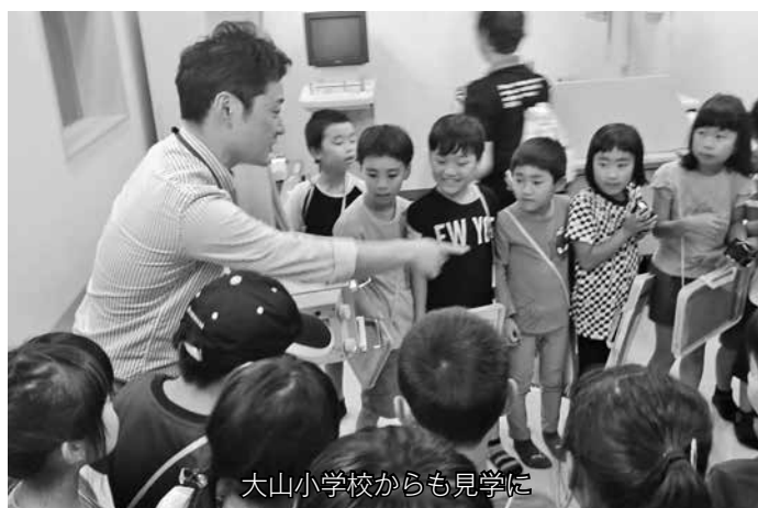
大山小学校からも見学に