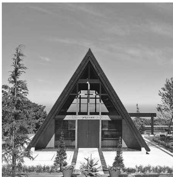
杵水高原の教会から新しい人生を

【大杖】本町の子育て支援策も重要と思うが、その前に子どもを生み育てられる環境作りの支援、婚活イベントの実施が必要であると考える。