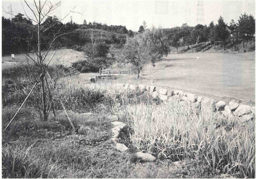
ここに藤公園を作りたい