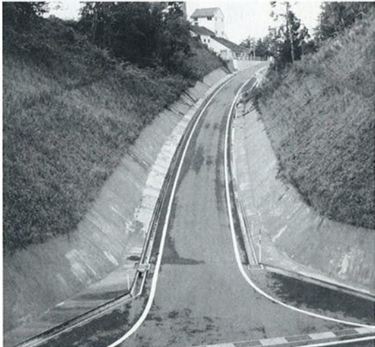
工事が完成した報国羽田井線

字が大きく、使用料の適正化に向け、旧町ごとの料金体系の早期統一が必要になっている。