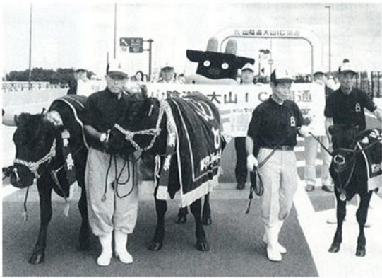
和牛王国復活に様々な取組み