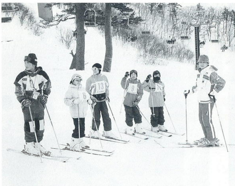
積雪にはめぐまれた昨シーズンの中の原スキー場

販売が可能になる。ブランド名にふさわしい品質の確保と、普及していく上での数量の確保が課題になっている。