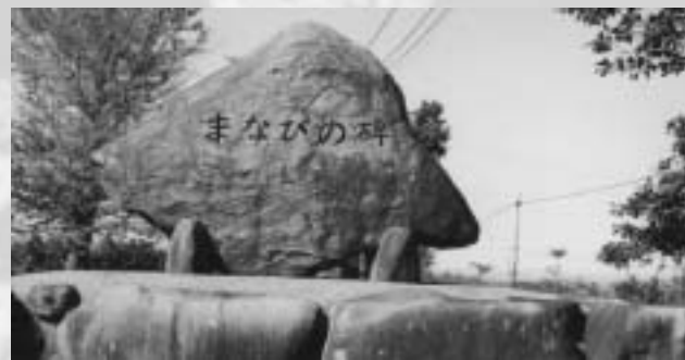
大山農場分校開校40周年を記念しての碑

大山農場地区の開墾は、昭和4年10月に4戸の入植者によって開始されましたが、なかなか計画通り進まないなど困難を極めました。それでも昭和10年には総戸数が22戸となりました。しかしこの昭和10年には、未曾有の風害や野火による10戸の焼失など、大きな災難が続ききました。それらの災難を入植者のみなさんが助け合い、復興にあたられました。その後開拓地の畑作