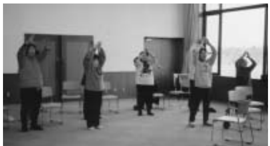
みんなで楽しく筋力トレーニング

高齢化社会を迎えて、転倒による骨折が増加しています。足・腰を鍛えるために、人権交流センター・玉真園及び町内の各公民館・集会所で簡単な筋力トレーニング・骨密度測定・健康相談をおこなっています。