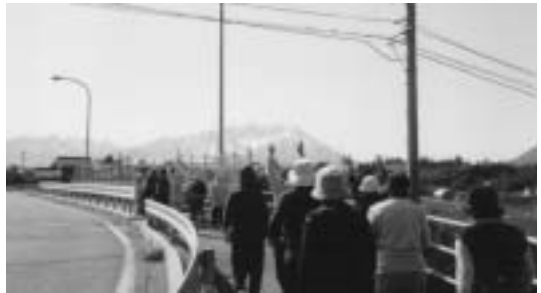
大山を見ながら、りんご橋の上で...

毎月末の水曜日、午前9時から45分程度歩きます。歩くコースはながめの美しいところばかりです。次回6月30日(水)は御来屋漁港まで歩く予定にしています。どなたでも参加できますので、当日9時までに保健福祉センターにお集まりください。