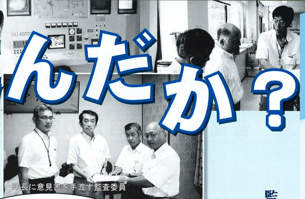
町長に意見書を手渡す監査委員