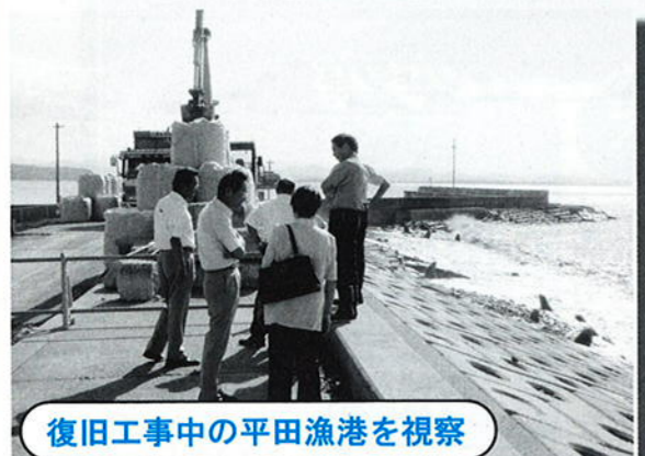
復旧工事中の平田漁港を視察

浸食陥没した平田漁港を 視察した。国の災害指定を 受け復旧工事中である。 耕作放棄地を再生した小枕 持倉団地では粗飼料やプロ ツコリー、白ネギの作付が されていた。 6月に富岡集落から陳情 があった通学道は、進入禁 止時間の変更が近く実施さ れる。 また、要望があったカー プミラーの設置も今年度中 には完了する。