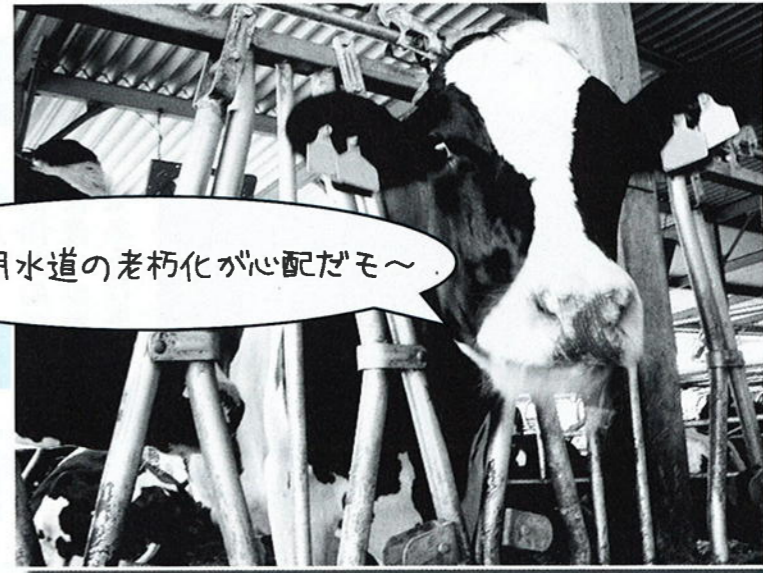
開拓専用水道の老朽化が心配だも～

平成21年度末時点での滞納額 町営住宅の家賃滞納総額は約686万円。 水道料金の滞納総額は約2551万円。