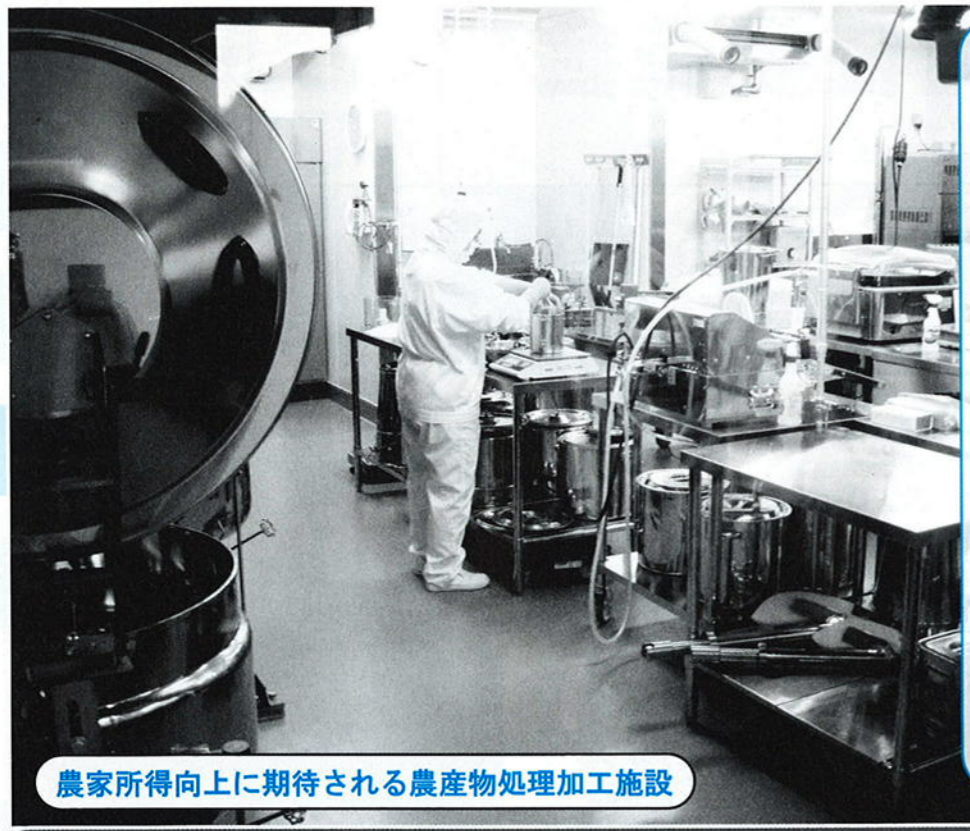
農家所得向上に期待される農産物処理加工施設

行 政が行う県内初の農 産物処理加工施設が 3月完成し、7月から本 格稼働に入っている。 今後は、販売先の確保 と主力となる商品開発に 期待する。 耕作放棄地再生利用推 進事業は、17件16haを 実施した。