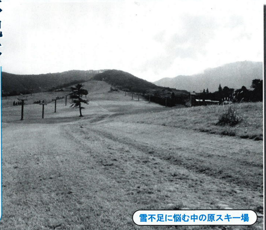
雪不足に悩む中の原スキー場

実 行された融資に対して、 支払った保証料の2 分の1の補助事業に15 00万円の支出。 お買い物券の発行には、 プレミアム部分と事務費 で2100万円を補助した。 索道事業会計はスキー 離れや趣味の多様化、近 年の雪不足により145 4万円の純損失となった。