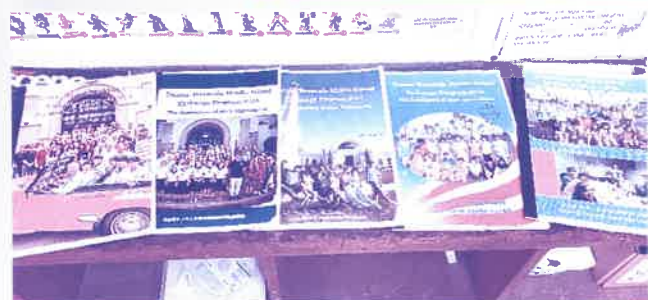
◀▲各学校での展示の様子

新型コロナウイルス感染症が終息し、テメキュラ市との中学生交流が一日でも早く再開され、テメキュラ市の皆さんの笑顔に出会えることを心から祈っています。