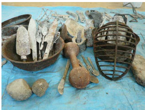
石や刃物、鉄アレイも…

名和クリーンセンターでは、可燃ごみを1日約8トン焼却処理しています。焼却処理された焼却灰の中から、不燃物が多数見つかります。