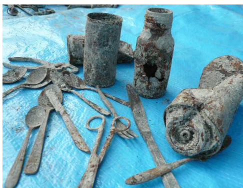
スプーンは多く見られます。