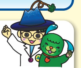
大山町健康推進キャラクター しょくとくくん&めくみん