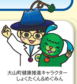
大山町健康推進キャラクター しよくたくん&めぐみん