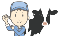
農地の権利名義を持たない畜産農業者