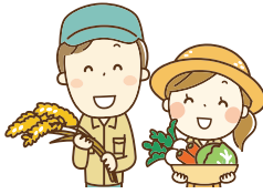
後継者とその配偶者