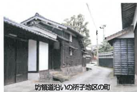
坊領道沿いの所子地区の町

横手道沿いで博労宿が軒を連ねた かぎりかき 下蚊屋や みつくえ 御机の街道筋には往時の面影が、また、坊領道沿いの集落では各家で仔牛生産をした家屋の配置や牛繋ぎ石などが今も残っています。とりわけ、所子の農家では、牛が母屋と同じ屋敷地の中に建てられた うまや 厩で飼われ、大山の山頂で汲まれた霊水や摘まれた薬草を仔牛に含ませるなど、牛馬市に出す牛を大切に育てていた当時のようすをよくとどめています。