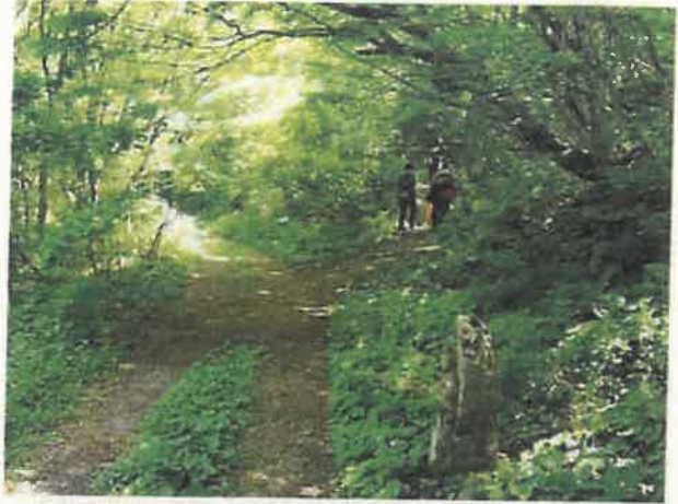
⑮大山道 (横手道) と一町地蔵