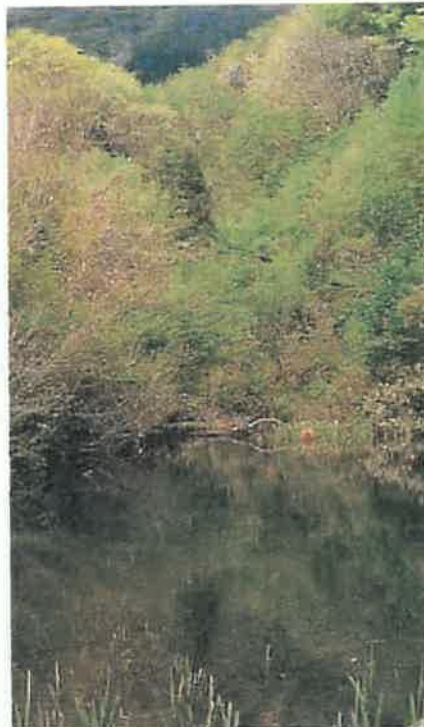
㉑池さん神事 (硯ヶ池)