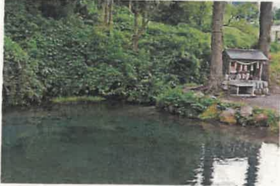
⑬地蔵滝の泉と地蔵滝地蔵