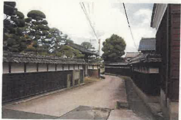
⑰大山町所子伝統的建造物群保存地区